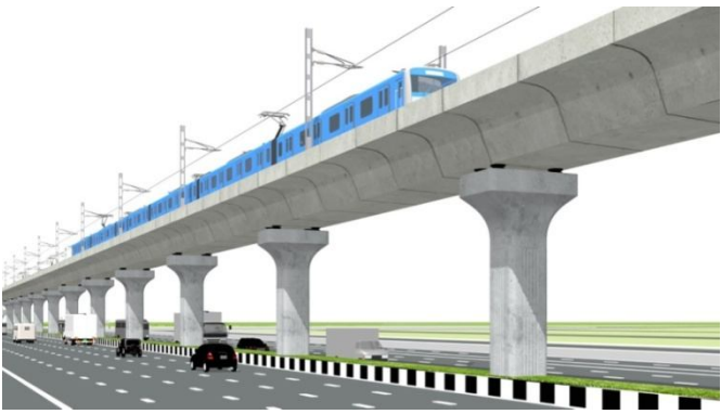
řgřUřřı řřřk (řıçřřřı)